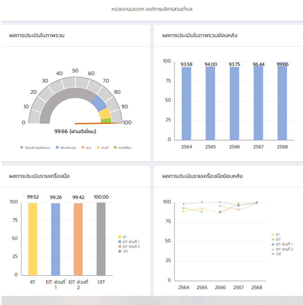
หน่วยงานประเภท องค์การบริหารส่วนตำบล